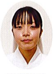
ま舞 けい 舞 18歳 ちくに ゆう 千代 大町市

まだまだ足りない自分ですが、今後とも暖かく見守っていただき、ご指導を受け精進して参ります。よろしくお願致します。