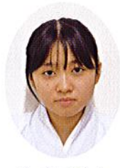
ま舞 けい 舞 18歳 ちくに ゆう 千代 大町市

4月から本格的に奉仕が始まり、さらに覚えることも増えていきました。戸惑ってしまう事もあり迷惑をかけてしまう事も多くありました。先輩方が丁寧に教えて下さりとても助かりました。1日でも早く仕事を覚え、この1年間で成長できるように努力し1日1日を大事に仕事に取り組みたいと思います。今後ともよろしくお願致します。