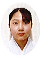
つき月 ちはら 前田 18歳 くさ まはつき 草間 松川村

私は皇學館大学卒業後、新潟県新潟市に坐す白山神社で6年間奉仕して参りました。御神徳が結びということもあり、地域や人々との繋がりを表心に神明奉仕して参りました。穂高神社に於いても地域に愛され、地域と共に発展し、地域を見守り続ける由緒正しき神社であります。浅学菲才の身では御座いますが、地域の為、引いては神社界の益々の発展の為に尽力していく所存でありますので御指導御鞭撻の程宜しくお願い申し上げます。